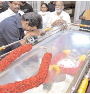
తెలిపింది. అంతకుముందు, తమిళ ఫిల్మ్ యాక్టివ్ ప్రొడ్యూసర్స్ అసోసియేషన్ తమ వ్యవస్థాపకుడు, దిగ్గజ దర్శకుడైన భారతీరాజ తుది విధేయలకు తరువాయి 2లో

'దర్శక ఇమయం' భారతీరాజ కన్నుమూశారు. తమిళ చలనచిత్ర పరిశ్రమకు ఆయన చేసిన అనూహ్య సేవలకు గుర్తింపుగా ఈ నిర్ణయం తీసుకున్నట్లు ప్రభుత్వం