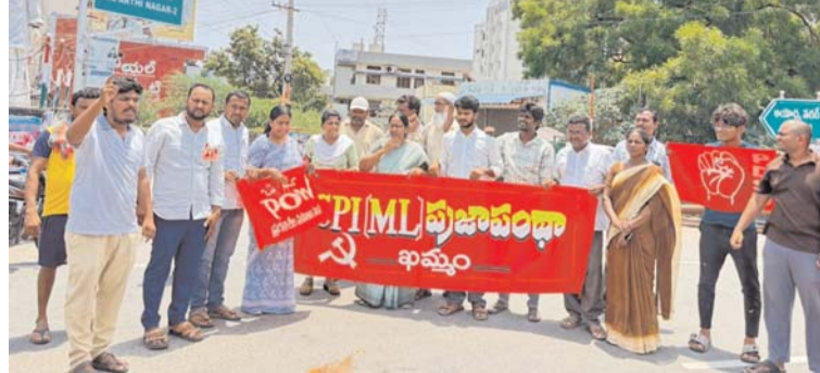
తీసుకోవాలని డిమాండ్ చేశారు. డబ్బూ జిల్లా సహాయ కార్యదర్శి కోట్, పి వై ఎల్ జిల్లా కార్యదర్శి భరత్, పి డి ఎన్ యు కుటుంబాన్ని ఆర్థికంగా ఆదుకోవాలని, ఈ సంఘటనపై ప్రభుత్వం వెంటనే ఫాస్ట్ ట్రాక్ కోర్టు ఏర్పాటు చేసి నిందితుడికి తక్షణమే శిక్ష వదిలించుకోవాలని వారు ప్రభుత్వాన్ని డిమాండ్ చేశారు. ఈ కార్యక్రమంలో టి యు

విచారణ చేయాలని వారు కోరారు. బాలికలు, మహిళలకు రక్షణ లేకుండా పోతుందని ఈ సందర్భంగా ఆవేదన వ్యక్తం చేశారు. దేశంలోని నిర్ణయ చట్టం లాంటి చట్టాలు ఉన్నా కూడా ప్రభుత్వ వాటిని సక్రమంగా అమలు చేయకపోవడం వలన ఇలాంటి సంఘటనలు మళ్ళీ మళ్ళీ పునరావృతం అవుతున్నాయని వారు అన్నారు.కాబట్టి ఇది పూర్తిగా ప్రభుత్వ వైఫల్యం.అందుకే ఈ చట్టాలను పక్కనపెట్టి అమలు చేయాలని వారు కోరారు. ఇలాంటి సంఘటనలు సమాజానికి మాయని మచ్చలాంటివని వారు అన్నారు నిందితులను అధికార పార్టీకి చెందిన మాజీ కార్యదర్శి కౌంట్ కౌంట్ చేయడం వల్ల ప్రభుత్వం అమలు చేయాలని వారు కోరారు. ఇలాంటి సంఘటనలు సమాజానికి మాయని మచ్చలాంటివని వారు అన్నారు నిందితులను అధికార పార్టీకి చెందిన మాజీ కార్యదర్శి కౌంట్ కౌంట్ చేయడం వల్ల ప్రభుత్వం అమలు చేయాలని వారు కోరారు. ఇలాంటి సంఘటనలు సమాజానికి మాయని మచ్చలాంటివని వారు అన్నారు నిందితులను అధికార పార్టీకి చెందిన మాజీ కార్యదర్శి కౌంట్ కౌంట్ చేయడం వల్ల ప్రభుత్వం అమలు చేయాలని వారు కోరారు.