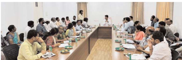
కేటాయింపులను కోరారు. అన్ని శాఖలు సమన్వయంతో పని చేసి డబుల్ బెడ్రూమ్ కాలనీలను అదర్శవంతమైన నివాస సముదాయాలుగా తీర్చిదిద్దాలని అన్నారు. ఈ సమావేశంలో వివిధ ప్రాంతాలకు చెందిన