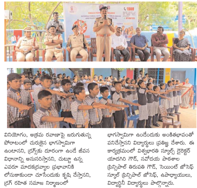
వినియోగం, అక్రమ రవాణాపై జరుగుతున్న పోరాటంలో చురుకైన భాగస్వామిగా ఉంటానని, ద్రగ్స్ కు దూరంగా ఉండే జీవన విధానాన్ని అనుసరిస్తానని, చుట్టూ ఉన్న ఎవరూ మాదకద్రవ్యాల ప్రభావానికి లోనుకాకుండా చూసేందుకు కృషి చేస్తానని, ద్రగ్ రహిత సమాజ నిర్మాణంలో

సాధిస్తే, అది తల్లిదండ్రులతో పాటు ఉపాధ్యాయులకు కూడా గర్వకారణమవుతుందని పేర్కొన్నారు. ప్రతి విద్యార్థి క్రమశిక్షణతో చదువుకొని సమాజానికి ఆదర్శంగా నిలవాలని సూచించారు. మాదకద్రవ్యాల వినియోగం వల్ల వ్యక్తిగతంగా, కుటుంబపరంగా, సామాజికంగా తీవ్ర నష్టాలు సంభవిస్తాయని తెలిపారు. ద్రగ్స్ వినియోగం, అక్రమ రవాణా వల్ల కలిగే ప్రమాదాలపై విద్యార్థులు సంపూర్ణ అవగాహన కలిగి ఉండడంతో పాటు, తమ కుటుంబ సభ్యులు, స్నేహితులు, పరిసర ప్రాంత ప్రజలకు కూడా అవగాహన కల్పించాలని కోరారు. ఎవరైనా మాదకద్రవ్యాలను వినియోగిస్తున్నట్లు లేదా వాటి అక్రమ రవాణాకు పాల్పడుతున్నట్లు తెలిసిన వెంటనే పోలీసులకు సమాచారం అందించాలని సూచించారు. ఇందుకోసం అత్యవసర సహాయ సంఖ్య 100 లేదా సంబంధిత పోలీస్ స్టేషన్ నంబర్లకు సమాచారం ఇవ్వాలని తెలిపారు. ఈ సందర్భంగా విద్యార్థులతో మాదకద్రవ్యాల వ్యతిరేక ప్రతిజ్ఞ చేయించారు. మాదకద్రవ్యాల