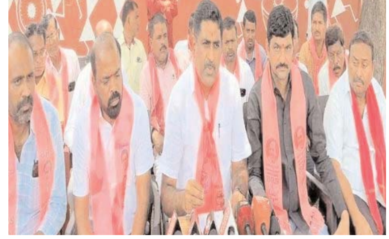
భూగర్భ జలాలను పెంచడమే కాకుండా, కాళేశ్వరం పంటి ప్రాజెక్టుల ద్వారా బీడు భూములను సైతం సస్పాన్సయించి చేశారు. తెలంగాణ రైతు కోసం బీఆర్ఎస్

అందోళన కలిగిస్తోంది. 2014 నుండి 2023 వరకు కేసీఆర్ నాయకత్వంలో తెలంగాణ రైతులు రాజుల్లా బతికారు. కానీ రేవంత్ రెడ్డి పాలనలో మళ్ళీ రైతుల జీవితాలు దయనీయంగా మారాయి. ఉమ్మడి ఆంధ్రప్రదేశ్ కాలంలో గోదావరి, కృష్ణా నదుల జలాలు ఉన్నా తెలంగాణ రైతుకు ఉపయోగపడలేదు. కరెంట్ లేక మోటార్లు కాలిపోవడం, ట్రాన్స్మిషన్లు పేలిపోవడం, నీటి కొరతతో రైతులు దశాబ్దాలు పాటు తీవ్ర ఇబ్బందులు పడ్డారు. ఇప్పుడు మళ్ళీ అలాంటి పరిస్థితిలే తనిపిస్తున్నాయి. తెలంగాణ రాష్ట్రం ఏర్పడిన తర్వాత తొలి ముఖ్యమంత్రి కల్వకుంట్ల చంద్రశేఖర్ రావు (కేసీఆర్) రైతు సంక్షేమమే లక్ష్యంగా చారిత్రాత్మక సంస్కరణలు తీసుకువచ్చారు. మిషన్ కాకతీయ ద్వారా సుమారు 45 వేల చెరువులను పునరుద్ధరించి