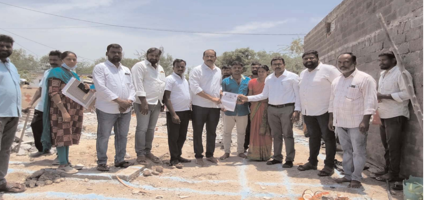
తెలిపారు. తమ సొంత ఇంటి కల నెరవేరబోతున్నందుకు లబ్ధిదారులు ఆనందం వ్యక్తం చేస్తూ రాష్ట్ర ప్రభుత్వం మరియు మున్సిపాలిటీ అధికారులకు కృతజ్ఞతలు తెలిపారు. ఈ కార్యక్రమంలో మున్సిపల్ కమిషనర్ కె. రవీందర్

నల్గొండ జిల్లా ప్రతినిధి । ది. క్రైమ్ న్యూస్ । జూన్ 20 స్థలం: హోలీయూ మున్సిపాలిటీ, నల్గొండ జిల్లా హోలీయూ మున్సిపాలిటీ పరిధిలోని 2, 4, 7, 8, 10, 11 వార్డులలో నేడు ఇందిరమ్మ ఇళ్ల నిర్మాణాలకు భూమి పూజ కార్యక్రమం ఘనంగా నిర్వహించబడింది. ఈ కార్యక్రమానికి హోలీయూ మున్సిపాలిటీ గౌరవ చైర్మన్ శ్రీ చింతల చంద్రారెడ్డి గారు ముఖ్య అతిథిగా హాజరై లబ్ధిదారులతో కలిసి భూమి పూజ నిర్వహించారు. ఈ సందర్భంగా చైర్మన్ శ్రీ చింతల చంద్రారెడ్డి గారు మాట్లాడుతూ, పేద ప్రజలకు గృహవసతి కల్పించడం రాష్ట్ర ప్రభుత్వం యొక్క ప్రధాన లక్ష్యమని అన్నారు. ఇందిరమ్మ ఇళ్ల పథకం ద్వారా అర్హులైన ప్రతి కుటుంబానికి సురక్షితమైన, శాశ్వత నివాసాన్ని అందించేందుకు ప్రభుత్వం కట్టుబడి ఉందని తెలిపారు. మున్సిపల్ కమిషనర్ కె. రవీందర్ రెడ్డి గారు మాట్లాడుతూ, తెలంగాణ ప్రభుత్వం ప్రతిష్టాత్మకంగా అమలు చేస్తున్న ఇందిరమ్మ గృహ పథకం ద్వారా హోలీయూ మున్సిపాలిటీని గుడిసెలు లేని మున్సిపాలిటీగా మార్చడమే లక్ష్యమని చెప్పారు. ఖాళీ స్థలం ఉండి గుడిసెలతో వివస్థనున్న అర్హులైన లబ్ధిదారులకు శాశ్వత గృహాల అందించేందుకు ప్రభుత్వం ప్రాధాన్యతా ప్రాతిపదికన చర్యలు చేపడుతోందని వివరించారు. హోలీయూ మున్సిపాలిటీలో ఇప్పటి వరకు మొత్తం 298 ఇందిరమ్మ ఇళ్లకు భూమి పూజ కార్యక్రమాలు నిర్వహించబడినట్లు అధికారులు