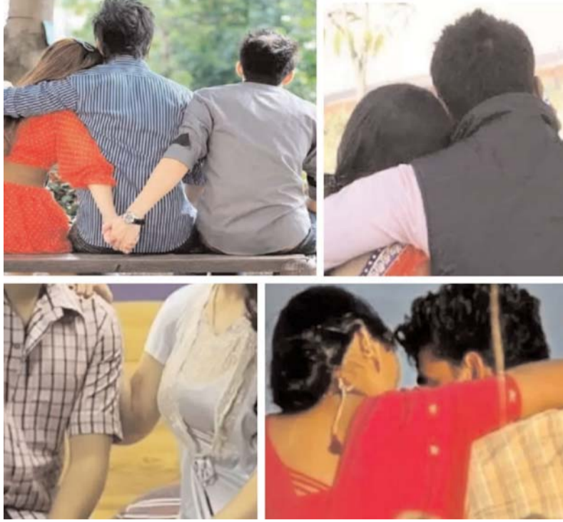
ఒప్పుదం చేసుకొని గుట్టు చప్పుడు కాకుండా మధిర నుండి బదిలీ చేయించుకొని వెళ్ళిపోయారు. మరో మహిళా మధిర పట్టణంలో చిన్న చిన్న కాంట్రాక్టు పనులు

మధిర ప్రతినది (డి క్రైమ్ న్యూస్): మధిర పట్టణంలో ఇటీవలి కాలంలో సహజీవనాలు (లైవ్-ఇన్ రిలేషన్షిప్స్) మరియు వివాహాంతర సంబంధాలు పెరిగిపోతున్నాయి. ఈ సంబంధాలు గుట్టు చప్పుడు కాకుండా సాగి నన్నాళ్లు ఎవరికీ ఎటువంటి ఇబ్బంది లేదు. ఇరువురు మధ్య ఆర్థికపరమైన సంబంధాలు విషయంలో ఘర్షణలు పెరిగి కేసులు వరకు వెళ్ళటంతో అప్పటివరకు కొనసాగిన సహజీవనాలు అత్యాచారం కేసులుగా సమాధులు అవుతున్నాయి. దీంతో క్షణికావేశంతో చేసిన తప్పులకి జైలుకు వెళ్ళాల్సిన పరిస్థితులు ఏర్పడ్డాయి. మేజర్లైన స్త్రీ పురుషులు ఇరువురు ఇష్టంతో సహజీవనం చేస్తే తప్పు కాదని కోర్టులు తీర్పు ఇవ్వటంతో పాటు కేసులు సమాధులు చేయొద్దని తీర్పు ఉండటంతో పోలీసులు ఏమీ చేయలేకపోతున్నారు. ఇటీవల మధిరలో జరిగిన ముచ్చికి కొన్ని సంఘటనలు మాత్రమే పరిశీలిద్దాం. మధిరకు ఉద్యోగ నిమిత్తం వచ్చిన ఒక అధికారితో పట్టణానికి చెందిన ఒక మహిళా వివాహాంతర సంబంధం పెట్టుకుంది. కొన్ని నెలలు తర్వాత ఇరువురు మధ్య విభేదాలు రావడంతో ఆమె కేసు పెడతామని బెదిరించడంతో ఆ అధికారి పరువు పోతుంది భయంతో నెలకి ఆమెకు 30 వేల రూపాయలు ఇచ్చే విధంగా