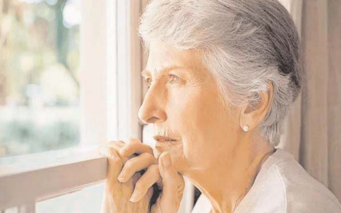
వృద్ధులు, వారి కుటుంబాలు అవసరమైన సహాయం పొందగలిగేలా ముందస్తు చర్యలు తీసుకోవాలని సిఫారసు చేస్తున్నారు. సకాలంలో రోగ నిర్ధారణ చేయడం వల్ల మెరుగైన చికిత్స అందించే అవకాశం ఉంటుందని చెబుతున్నారు.

చిత్త వైకల్యాన్ని సకాలంలో నిర్ధారించడం.. ప్రధాన సవాలుగా మారుతున్నది. మనిషి జ్ఞాపకశక్తిని దెబ్బతీసి ఈ మానసిక రుగ్గుత.. చాలా అలసటగా బయటపడుతున్నది. లక్షణాలు కనిపించినా.. సంపూర్ణంగా నిర్ధారించడానికి సగటున మూడున్నరేళ్ల సమయం పడుతున్నది. 'ఇంటర్నెషనల్ జర్నల్ ఆఫ్ జెరియాట్రిక్ సైకియాట్రిలో ప్రచురితమైన తాజా అధ్యయనం ఈ విషయాన్ని వెల్లడించింది. డైమెన్షియా నిర్ధారణపై 'యూనివర్సిటీ కాలేజ్ లండన్లోని సైకియాట్రి విభాగానికి చెందిన పరిశోధకులు తాజాగా ఓ అధ్యయనం నిర్వహించారు. ఇందుకోసం యూరప్, అమెరికా, ఆస్ట్రేలియా, చైనాలో ఇంకా ముందే ప్రచురితమైన 13 అధ్యయనాలను క్లుప్తంగా పరిశీలించారు. ఈ సందర్భంగా 30,257 మందికి చెందిన డేటాను సమీక్షించారు. ఇందులో భాగంగా.. చిత్త వైకల్యం ప్రపంచవ్యాప్తంగా 57 మిలియన్లకు పైగా ప్రజలను ప్రభావితం చేస్తున్నదని గుర్తించారు. చాలా దేశాలలో రోగ నిర్ధారణ సర్టిఫికేట్ల జరగడం లేదని చెబుతున్నారు. చిత్త వైకల్యం ప్రారంభ దశలో జ్ఞాపకశక్తి కోల్పోవడం, పదాలను కనుగొనడంలో ఇబ్బంది, గందరగోళంతోపాటు మానసిక స్థితి, ప్రవర్తనలో మార్పులు కనిపిస్తాయని అధ్యయనకారులు పేర్కొంటున్నారు. చాలామంది ఈ డైమెన్షియా లక్షణాలను సాధారణ వృద్ధాప్య లక్షణాలుగా భావిస్తున్నారనీ, దాంతో వారికి సరైన వైద్యసాయం అందడం లేదని అంటున్నారు. కొందరిలో సైట్.. రోగ నిర్ధారణకు 4.1 ఏళ్లు పట్టవచ్చునని పేర్కొంటున్నారు. దాంతో బాధితులకు మెరుగైన చికిత్స అందించడం అలసటపడుతున్నదని ఆందోళన వ్యక్తం చేస్తున్నారు. దీనిని నివారించడానికి.. డైమెన్షియా ప్రారంభ లక్షణాలపై అవగాహన కార్యక్రమాలు నిర్వహించాలని, చిత్త వైకల్యం ఉన్న