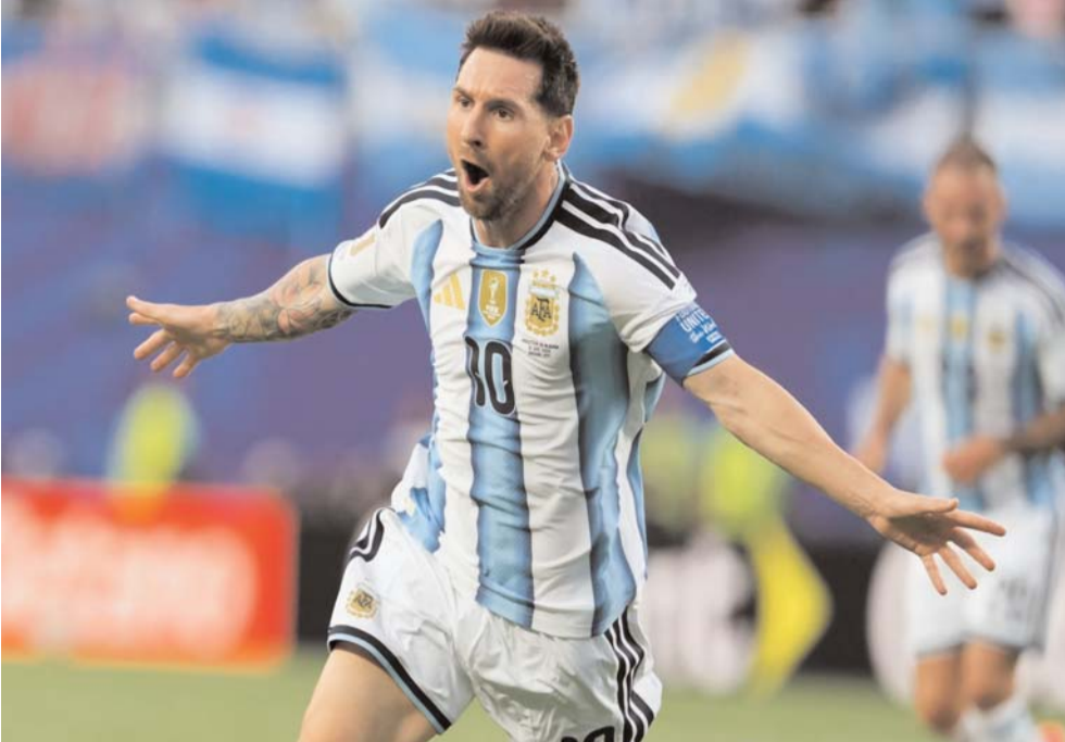
చేసిన సెకండ్ ఫ్లేయర్ గా రికార్డుకెక్కాడు. ఈ హాట్రిక్ తో మెస్సి వరల్డ్ కప్ టోటల్ గోల్స్ సంఖ్య 16కు చేరింది. జర్మనీ లెజెండ్ మిఖైల్ ఓజెన్ కోచ్ చాలా కాలంగా మెయింటైన్ చేస్తున్న ఆల్ టైమ్ గోల్ సౌరింగ్ (16 గోల్స్) రికార్డును మెస్సి సమం చేశాడు. అర్జెంటీనా డిఫెన్స్ టైటిల్ రెసుల్ట్ ఇంకా చాలా మ్యాచ్ లు మిగిలిన కంట్రాస్ట్ మెస్సి ఈ రికార్డును బ్రేక్ చేయడం చాలా ఈజీ అని

ఫుట్ బాల్ లెజెండ్ లియోనెల్ మెస్సి తన సుదీర్ఘ కెరీర్ లో మరో అద్భుతమైన చాప్టర్ యాడ్ చేశాడు. డిఫెండింగ్ ఛాంపియన్ అర్జెంటీనాను లీడ్ చేస్తూ అవ్వరియాపై 3-0 తేడాతో ఘనవిజయం సాధించడంలో మెస్సి కీ రోల్ ప్లే చేశాడు. 38 ఏళ్ల వయసులో మెస్సి వరల్డ్ కప్ ఛాంపియనేషన్ ఫస్ట్ ఎవర్ హాట్రిక్ గోల్స్ సాధించి రికార్డు సృష్టించాడు. ఈ మ్యాచ్ లో ఫస్ట్ హాఫ్ లో ఒక గోల్ కొట్టిన మెస్సి, సెకండ్ హాఫ్ స్టార్ట్ అయిన కొద్దిసేపటికి సింపుల్ టాప్-ఇన్ తో రెండో గోల్ చేశాడు. ఆ తర్వాత 76వ నిమిషంలో తన ట్రైడ్ మార్క్ స్ట్రైక్ మూడో గోల్ పూర్తి చేసి హాట్రిక్ నమోదు చేశాడు. దీంతో ఆరోహెడ్ స్టేడియంలో ఉన్న వేలాది మంది అర్జెంటీనా ఫ్యాన్స్ సంతోషంతో మునిగిపోయారు. మెస్సి కెరీర్ లో ఇది 61వ హాట్రిక్ కాగా అర్జెంటీనా తరపున 11వ హాట్రిక్ కావడం విశేషం. ఈ ట్రైబుల్ తో వరల్డ్ కప్ లో పరుగుగా ఐదు మ్యాచ్ లో గోల్స్ చేసిన ఫ్లేయర్ గా మెస్సి నిలిచాడు. ఈ మ్యాజిక్ కలెక్షన్ మెస్సి లైఫ్ లో చాలా సైచల్ గా నిలిచిపోతుంది. మెస్సి 2006 లో జర్మనీ వేదికగా సెర్బియా, మెంటెనెగ్రోపై వరల్డ్ కప్ డెబ్యూ మ్యాచ్ ఆడి గోల్ కొట్టాడు. సగ్గా 20 ఏళ్ల తర్వాత అదే రోజున ఈ మైలరాయిని అందుకోవడం విశేషం. అర్జెంటీనా తరపున 200వ అప్పీయరెన్స్ ఇచ్చిన ఈ ఎనిమిది సార్లు బ్యాలన్ డి ఓర్ విన్సర్, హార్మంగల్ స్టార్ క్రిస్టియోనో రొనాల్డో తర్వాత ఐదు వేర్వేరు వరల్డ్ కప్ ఎడిషన్ లో గోల్స్