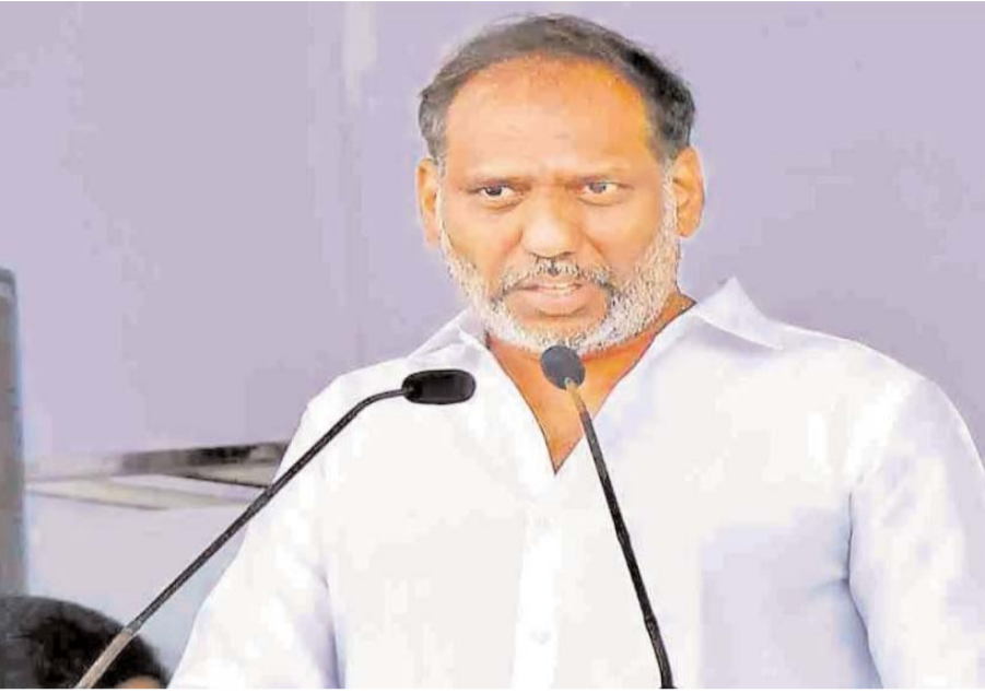
మారడం లేదని, ఇంగితం లేకుండా ప్రవర్తిస్తున్నారని వ్యాఖ్యానించారు. మహిళలపై ద్వేషంతోనే వైసిపి నేతల వ్యాఖ్యలు చేస్తున్నారన్నారు. మహిళల పట్ల చురుకైనగా హెచ్చరించారు. ప్రజలు బుద్ధి చెప్పినా ఇంకా

అనితను రాజకీయంగా ఎదుర్కోలేక వ్యక్తిత్వ హాననం జగన్, వైసిపి తీరుపై మండిపడ్డ మంత్రి గొట్టిపాటి