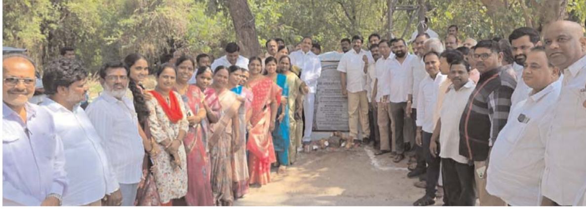
చేస్తామని తెలిపారు. అభివృద్ధి పనులను నాణ్యత ప్రమాణాలతో చేపట్టి నిర్ణీత సమయంలో పూర్తి చేయాలని అధికారులను ఆదేశించినట్లు చెప్పారు. ప్రజలకు ట్రాఫిక్ ఇబ్బందులు లేకుండా మెరుగైన రవాణా సౌకర్యాలు కల్పించేందుకు కృషి చేస్తామని పేర్కొన్నారు. ఈ సందర్భంగా ప్రజలు పెట్టెల్ నుంచి మక్తా మహబూబ్ పెద్దకది చెరువు కల్వర్టు వరకు రూ.68 లక్షలతో సీసీ రోడ్లు, జనప్రియ వెస్ట్ సిటీ కాలనీలో రూ.54 లక్షలతో సీసీ రోడ్లు, కమ్యూనిటీ హాల్ షోరింగ్, బొబ్బిలం మొయి రోడ్లు నుంచి