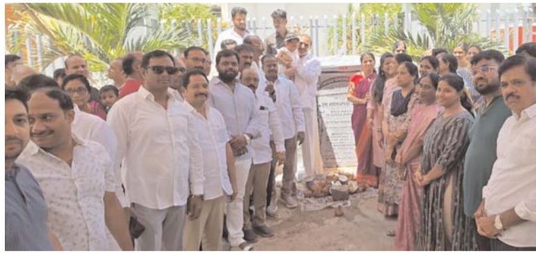
వేగవంతంగా పూర్తి చేసి అందుబాటులోకి తీసుకురాలని సూచించారు. ఈ సందర్భంగా దీప్తిశ్రీనగర్, ఇక్రికాల్ కాలనీలలో రూ.89 లక్షలతో, (ఫ్రెండ్స్) కాలనీలో రూ.61 లక్షలతో, ఇందిరానగర్, మంజీర్ పైన్లెన్డ్ అంతర్వేది రోడ్డు, సాయి