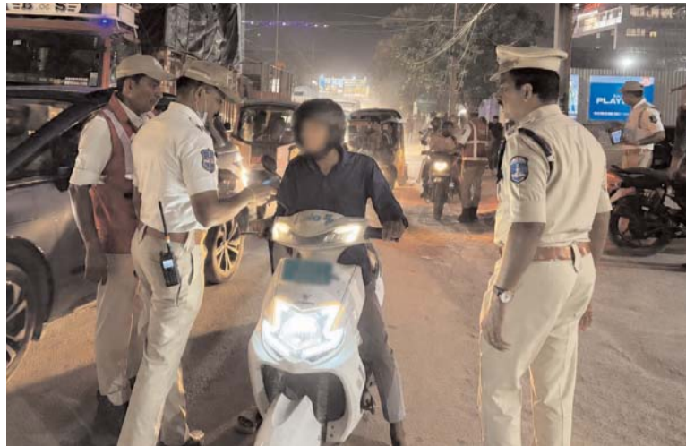
కేసులను కోర్టులు పరిష్కరించాయని అధికారులు వెల్లడించారు. వీరిలో 10 మందికి జరిమానాతో పాటు జైలు శిక్ష, 145 మందికి జరిమానాలు విధించినట్లు తెలిపారు.

మిల్లిగ్రాముల మద్యం, మరో 20 మంది 301 నుంచి 550 మిల్లిగ్రాముల మద్యం మద్యం సేవించి వాహనాలు నడుపుతూ పట్టుబడ్డారు. పట్టుబడిన వారందరినీ చట్టపరంగా కోర్టులో హాజరుపరుస్తామని పోలీసులు తెలిపారు. మద్యం సేవించి వాహనాలు నడపడం తీవ్రమైన నేరమని సైబరాబాద్ పోలీసులు మరోసారి హెచ్చరించారు. మద్యం మత్తులో వాహనం నడిపి ప్రమాదాలకు కారణమైతే భారతీయ న్యాయ సంహిత--2023లోని సెక్షన్ 105 కింద కేసులు నమోదు చేస్తామని పేర్కొన్నారు. ఈ నేరానికి గరిష్టంగా 10 సంవత్సరాల జైలు శిక్షతో పాటు జరిమానా విధించే అవకాశం ఉందన్నారు. ఇక గత వారం మే 18 నుంచి మే 23 వరకు మొత్తం 156 మద్యం సేవించి డ్రైవింగ్ చేసిన