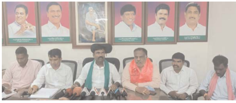
తల్లిదండ్రులను దాని, ఇంత వరకు రైతు కుటుంబాలను పరామర్శించని దౌర్జన్యపు ఎమ్మెల్యే కవ్వంపల్లెని ఆరోపించారు. రైతులకు హామీ ఇస్తేనే అధికారంలోకి వచ్చిన కాంగ్రెస్ పార్టీపార్టీని గుర్తుచేస్తూ పంట కొనుగోలు ప్రభుత్వంపై తిట్ల పురాణంతో కొత్తపల్లి, ఉటూరు క్వారీల లాంటి నాలుగు రోజులు వడ్డకొనుగోలుకు పెడితే చాలు నారాయణ, నారాయణ నీరయా అని రైతులు మొరపెడుతున్నారన్నారు. ఇల్లంతకుంట,

ఆరా తీయడం లేదని ప్రశ్నించారు. మిల్లర్ వద్ద జరిగే దోపిడీతో వడ్డకోత కాదిది మా కడుపుకోత, ఇంత నిరక్షమ ప్రభుత్వాన్ని ఇంత వరకు చూడలేదని రైతులు కన్నీళ్ళు పెడుతున్నారని మండిపడ్డారు. బీఆర్ఎస్ హయాంలో రిజర్వాయర్ల ద్వారా పొలాలకు నీరందించి పంటను ఏ-గ్రేడ్ తో కొనుగోలు చేస్తే నేడు ఏ-గ్రేడ్ ఉన్నదాన్ని బి-గ్రేడ్ కు తీసుకువచ్చి క్వింటాలుకు 2360 పెడుతున్నారని, ఒక్క ధాన్యం గింజైనా ఏ-గ్రేడ్ లా కనిపించడంలేదా అంటూ ప్రశ్నించారు. అసమానం గత ప్రభుత్వాన్ని విమర్శించే ఎమ్మెల్యే ధాన్యం కోతలో విడిచే 20రూపాయలు ఎవరు తింటున్నారో చెప్పాలని ప్రశ్నించారు. కల్లాల్లో పుట్టకొద్ది పంటపండించే రైతు నేడు కంచంలో మెతుకు దొరకక