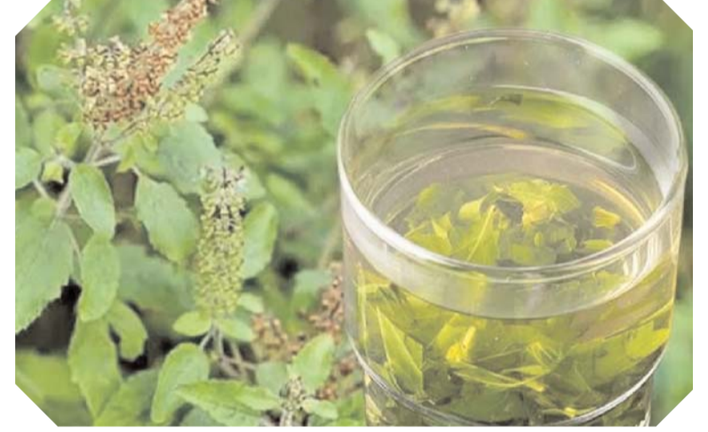
కార్మిసాల్ స్థాయిలు తగ్గుతాయి. అలాగే మీరు సహాయపడుతుంది. ఒత్తిడి లేకుండా ఉండేందుకు

యాంటీఆక్సిడెంట్, యాంటీమైక్రోబయల్ లక్షణాలు నిండివున్న తులసి రోగనిరోధక వ్యవస్థను పునరుద్ధరించడానికి, ఇన్ఫెక్షన్లతో పోరాడటానికి సహాయపడుతుంది. ఈ వేడి నీటిలో తులసి నీటిని తాగడం వల్ల అద్భుతమైన ప్రయోజనాలు ఉన్నాయని టునారు ఆరోగ్య నిపుణులు. ఖాళీ కడుపుతో తులసి నీటిని తాగడం వల్ల జీర్ణ సమస్యలు, కడుపునొప్పి, గ్యాస్, అసిడిటీ వంటి అసౌకర్యాల నుండి ఉపశమనం పొందవచ్చు. ఈ పానీయం శరీరాన్ని శుభ్రపరచడంలో, ఆరోగ్యకరమైన జీర్ణ ప్రక్రియను ప్రారంభించడంలో సహాయపడుతుంది. దాని యాంటీ ఇన్ఫ్లమేటరీ, యాంటీమైక్రోబయల్ లక్షణాలతో, తులసి నీరు దగ్గు, జలుబు లక్షణాలను తగ్గించడంలో సహాయపడుతుంది. క్యాన్సర్తో ఆరోగ్యాన్ని సమర్పవంతంగా బలోపేతం చేస్తుంది. తులసి ఆకులు