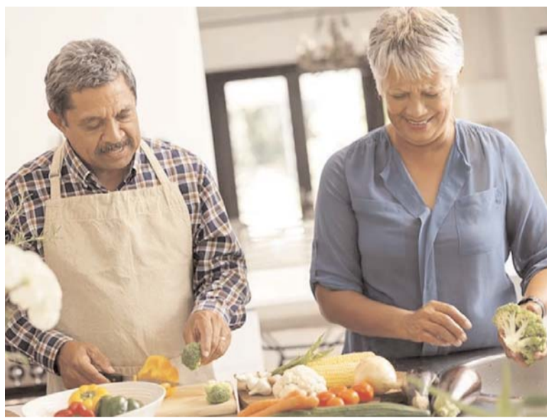
పుష్కలంగా ఉంటాయి. ఇవి చర్మాన్ని యవ్వనంగా ఉంచడంలో సహాయపడతాయి. వీటితోపాటు గ్రీన్ టీ ద్వారా కూడా చర్మాన్ని

ఇక్కడ తెలుసుకుందాం.. బెర్రీ పండ్లు యాంటీఆక్సిడెంట్లు, విటమిన్లు బెర్రీలలో పుష్కలంగా లభిస్తాయి. స్ట్రాబెర్రీలు, బ్లూబెర్రీస్, బ్లూక్వెర్రీస్ తినడం వల్ల చర్మం యవ్వనంగా ఉంటుంది. ఇందులో ఉండే యాంటీ ఆక్సిడెంట్లు చర్మంలో వేగవంతమైన మార్పులను నెమ్మదించేలా చేస్తాయి. దీనితో పాటు బెర్రీలు ఆక్సికరణ ఒత్తిడిని తొలగించడంలో కూడా సహాయపడతాయి. డ్రై ఫ్రూట్స్ బాదం, వాలనట్, జీడిపప్పు, వాలనట్, గుమ్మడికాయ గింజలు వంటి డ్రై ఫ్రూట్స్ చర్మానికి చాలా ప్రయోజనకరంగా ఉంటాయి. చర్మానికి మేలు చేసే డ్రై ఫ్రూట్స్ రోజూ తినడం వల్ల ఇందులో ఉండే విటమిన్-ఇ, ఒమేగా-3 ఫ్యాట్ యాసిడ్లు పుష్కలంగా చర్మానికి అందుతాయి. కొవ్వు చేప నాన్ వెజ్ ఫుడ్ ఇష్టపడే వారు చర్మాన్ని కాపాడుకోవడానికి ఫ్యాట్ ఫిషి ను తమ డైట్ లో చేర్చుకోవచ్చు. చర్మంపై కనిపించే వృద్ధాప్య సంకేతాలను నివారించడంలో ఇది చాలా ఉపయోగకరంగా ఉంటుంది. కొవ్వు చేపలలో ఒమేగా -3 కొవ్వు అమ్లాలు