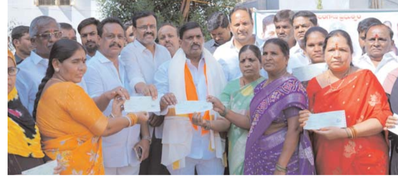
ప్రణాళికాబద్ధంగా నిధులు కేటాయిస్తున్నామని తెలిపారు. అభివృద్ధిలో ప్రతి ఒక్కరూ భాగస్వాములు కావాలని విజ్ఞప్తి చేశారు. ఈ కార్యక్రమంలో ప్రజా ప్రతినిధులు, మాజీ ప్రజాప్రతినిధులు, వివిధ శాఖల అధికారులు, నాయకులు, తదితరులు పాల్గొన్నారు.

ఆయన మాట్లాడుతూ ప్రత్యేక తెలంగాణ రాష్ట్రం ఏర్పడిన అనంతరం పేద, బడుగు, బలహీన వర్గాల కుటుంబాలకు అడవిపై పెళ్లి భారం కాకూడదన్న సమన్విత లక్ష్యంతో తెలంగాణ తొలి ముఖ్యమంత్రి కెసిఆర్ కళ్యాణ లక్ష్మి, షాదీ ముబారక్ అని విషవాతక పథకాన్ని పెట్టారని గుర్తు చేశారు. పటాన్వేరు నియోజకవర్గం వ్యాప్తంగా ప్రజల సంక్షేమం, అభివృద్ధి కార్యక్రమాలకు తొలి ప్రాధాన్యత ఇస్తూ ప్రజల ఆర్థిక అభివృద్ధికి పాటుపడుతున్నట్లు తెలిపారు.. నిరంతరం క్షేత్రస్థాయిలో పర్యటిస్తూ ప్రజల సమస్యలను ఎప్పటికప్పుడు తెలుసుకుంటూ వాటి పరిష్కారానికి