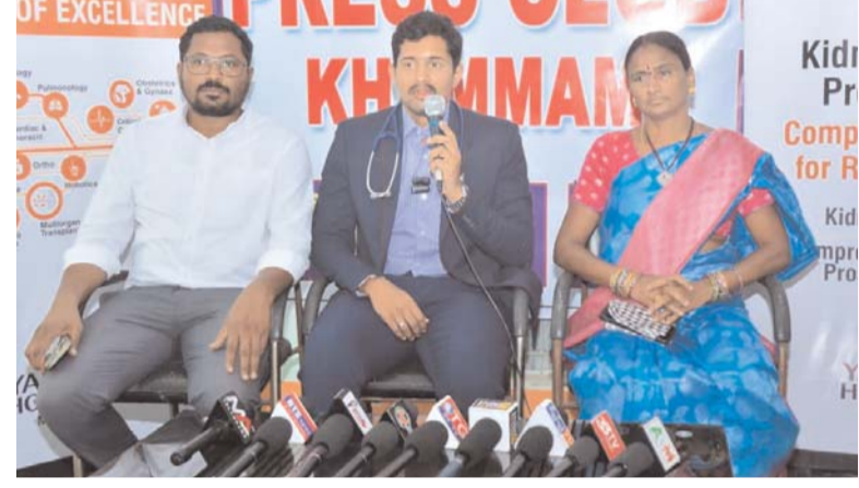
ఉండటం వల్లే ఇలాంటి క్లిష్టమైన కేసులకు విజయవంతంగా చికిత్స చేయగలుగుతున్నామని ఆసుపత్రి అధికారులు తెలిపారు. సంక్లిష్ట కిడ్నీ వ్యాధులకు సురక్షితమైన వైద్యం అందించడంలో తమ ఆసుపత్రి ఎల్లప్పుడూ ముందంజలో ఉంటుందని స్పష్టం చేశారు.

తొలగించారు. న్యూమోనియా మరియు పూరల్ ఎమ్ఫిజెమస్ ప్రత్యేక యాంటిబయోటిక్స్, శ్వాస సహాయక చికిత్స అందించగా, వ్యాధిని పనితీరును స్థిరపరచడానికి అవసరమైన చికిత్సలు కూడా చేశారు. సమయానికి చేపట్టిన చికిత్స, మల్టీ-డిస్ ప్లినరీ వైద్య బృందం సమన్వయం, అధునిక సాంకేతిక సదుపాయాల వల్ల రోగి ఆరోగ్యం మెరుగై ఎటువంటి క్లిష్టతలు లేకుండా డిశ్చార్జ్ అయ్యారు. ఇలాంటి క్లిష్టమైన సెప్టిక్ థర్సితగతిన చికిత్స అందించడం ప్రాణాలను కాపాడడంలో కీలకమైన వైద్యులు తెలిపారు. యశోద ఆసుపత్రిలో ఉన్న అత్యాధునిక ఐసీయూ సదుపాయాలు, హై-ఎండ్ డయాలిసిస్ యంత్రాలు, అనుభవజ్ఞులైన వైద్యుల బృందం అత్యాధునిక సాంకేతికత, నిపుణులైన వైద్యుల బృందం అందుబాటులో