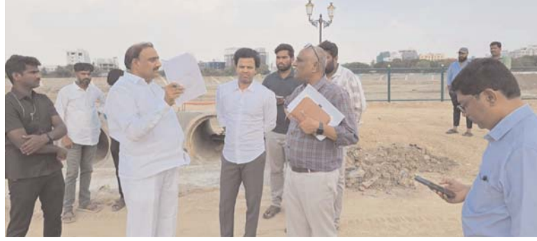
పేర్కొన్నారు. మాదాపూర్ డివిజన్ అభివృద్ధిలో భాగంగా మౌలిక వసతుల అభివృద్ధికి పెద్దపీట వేస్తామని, ప్రజలకు సౌకర్యవంతమైన రవాణా కల్పించేందుకు కృషి చేస్తున్నామని తెలిపారు. ఆదేవిధంగా రాజోయే పర్లాకాలాన్ని దృష్టిలో పెట్టుకుని నాలాల పూడికి తొలగించాలని, నీరు నిల్వ ఉన్న ప్రాంతాలను గుర్తించాలని, చెరువుల ఇన్ లెట్లను పరిశీలించి నీటి ప్రవాహం సాఫీగా

వాహనదారులు, సాఫ్ట్వేర్ ఉద్యోగులు తీవ్ర ఇబ్బందులు పడుతున్న సేవధ్యంలో రూ. 74 లక్షలతో సర్వీస్ రోడ్డు విస్తరణ పనులు చేపట్టడం జరుగుతుందని, దీని ద్వారా ట్రాఫిక్ సమస్యకు పరిష్కారం లభిస్తుందని చెప్పారు. ప్రజల సౌకర్యార్థం, మెరుగైన జీవన ప్రమాణాల కోసం ఈ పనులు చేపడుతున్నామని, రద్దీ ప్రాంతాల్లో అన్ని సదుపాయాలతో రోడ్డు విస్తరణ జరగాలని, పనులను త్వరితగతిన పూర్తి చేసి ప్రజలకు అందుబాటులోకి తీసుకురావాలని అధికారులను ఆదేశించారు. నాణ్యత విషయంలో ఎక్కడా రాజీ పడకూడదని, భవిష్యత్తులో వరద సమస్య మళ్ళీ పునరావృతం కాకుండా పటిష్ట చర్యలు తీసుకుంటున్నామని పేర్కొన్నారు. పనులు యుద్ధ ప్రాతిపదికన పూర్తి చేయాలని, నాణ్యత విషయంలో ఎక్కడా రాజీ పడకూడదని స్పష్టం చేశారు. పనులు సమయంలో ప్రజలకు ఇబ్బందులు కలగకుండా జాగ్రత్తలు తీసుకోవాలని, రవాణా సమస్యలు తలెత్తకుండా ప్రత్యామ్నాయ మార్గాలను ఏర్పాటు చేయాలని, నీటి ప్రవాహం సాఫీగా జరిగేలా సాంకేతిక ప్రమాణాలతో పనులు చేపట్టాలని