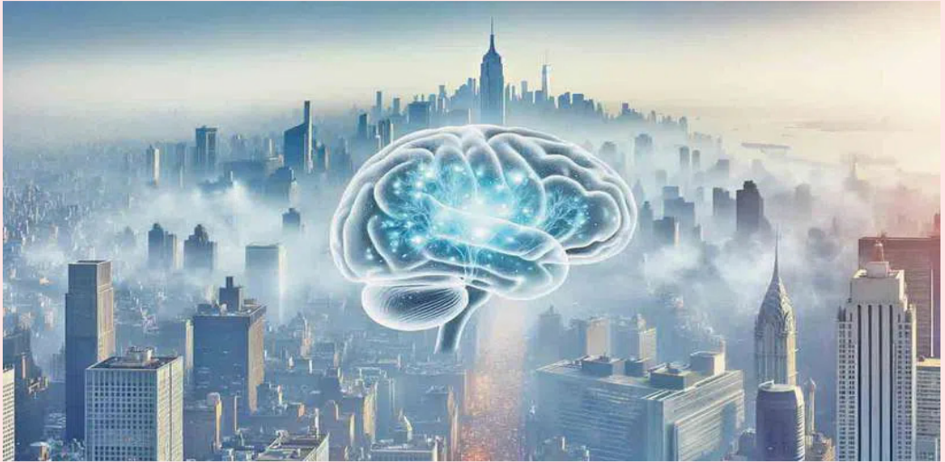
లాంటి లక్షణాలు కనిపిస్తే వెంటనే వైద్యులను సంప్రదించాలని నిపుణులు చెబుతున్నారు. ఇక కక్షపాటు, మధుమేహం, కొలిస్ట్రాల్ ను నియంత్రించేటట్లు ఉంచుకోవడంకోసాను ధూమపానం మానేయడం, చురుకైన జీవనశైలి, చెబుతున్నారు.

బ్రెయిన్ స్ట్రోక్ ప్రమాదాన్ని గాలి కాలుష్యం పెంచుతున్నది. ఏటా లక్షల మంది ప్రాణాలను తీస్తున్నది 2024 బయోమెడ్ సెంట్రల్ (బీఎంసీ) పబ్లిక్ హెల్త్ అధ్యయనం వెల్లడించింది. వాయు కాలుష్యం వల్ల ప్రపంచవ్యాప్తంగా దాదాపు ఇరవై లక్షల మంది స్ట్రోక్ బారిన పడుతున్నట్లు ఈ సర్వే తేల్చింది. భారతదేశంలో సహా తక్కువ, మధ్య ఆదాయ దేశాల్లో సంభవించే నాలుగు బ్రెయిన్ స్ట్రోక్ మరణాలలో.. ఒకటి గాలి కాలుష్యం వల్లనే కనుగొన్నది. ముఖ్యంగా.. నగరాలు, పట్టణ ప్రాంత యువకులు ఎక్కువగా దీని బారిన పడుతున్నట్లు వెల్లడించింది. పీఎం 2.5 వంటి సూక్ష్మ కణాలు.. ఊపిరితిత్తుల రక్షణ వ్యవస్థను దాటుకొని రక్తప్రవాహంలోకి ప్రవేశిస్తున్నాయి. రక్త నాళాల్లో అడ్డంకులు సృష్టించి.. బ్రెయిన్ స్ట్రోక్ కారణం అవుతున్నాయని అధ్యయనకారులు చెబుతున్నారు. మన దేశంలో మూడు రకాల్లోగా బ్రెయిన్ స్ట్రోక్ కేసులు వివరితంగా పెరుగుతున్నాయి. గాలి కాలుష్యం వల్ల స్ట్రోక్ బారిన పడుతున్నవారిలో యువతే ఎక్కువగా ఉంటున్నది. దాదాపు 20-30 శాతం స్ట్రోక్లు 50 ఏళ్లలోపు వారిలోనే సంభవిస్తున్నాయి. వీరిలో ప్రాణాలతో బయటపడిన వారిలో 50 శాతం మంది శాశ్వత వైకలాకాలతో మిగిలిపోతున్నారు. ఈ పరిస్థితిని తప్పించుకోవాలంటే.. ఆకస్మికంగా బలహీనపడవడం, మాటలు తడబడటం, మూఝం వారిపోవడం, శరీరం సమతుల్యత కోల్పోవడం