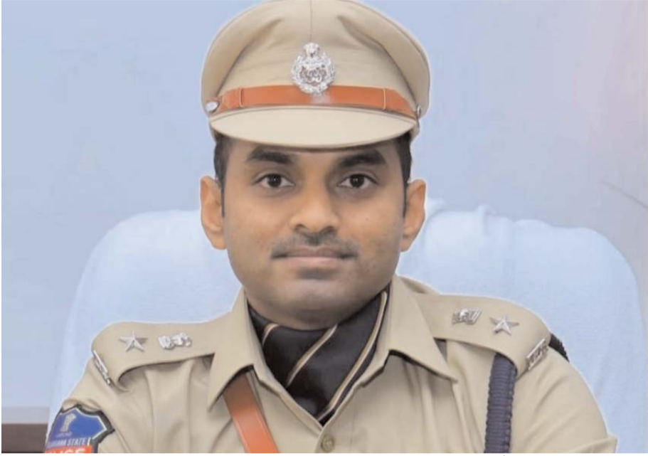
ఈ విధానం వల్ల బాధితులకు తక్షణ న్యాయం విశ్వాసం మరింత పెరుగుతోందని అన్నారు. ఆన్సెట్ ఎఫ్ఐఆర్ల నమోదు చేయడం ప్రధానం