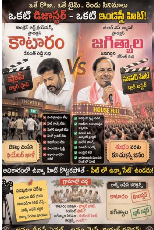
తగ్గట్టుగా ప్రజల సమస్యలు, భావోద్వేగాలతో ధీమేటి మారు మోగిపోయింది. ఒరిజినల్ సినిమా రంగంలో స్టార్ హీరోలు

బ్యారో.. (డి క్రైమ్ న్యూస్): పండగల సీజన్లో అగ్ర కథానాయకుల సినిమాలు రావడం మనందరికీ తెలుసు. సరిగ్గా అలాంటిది రాజకీయ రంగస్థలం మీద ఇద్దరు రాటు తేలిన అగ్ర నాయకుల సినిమాలు (సభలు) ఒకేసారి విడుదలై తెలంగాణ పొలిటికల్ బాక్సాఫీస్ వార్ సాగింది. ఒకవైపు కాంగ్రెస్ ఆర్ట్ క్రియేషన్స్ బ్యానర్ పై వచ్చిన "కాటారం రైతు ఉత్సవాలు"... మరోవైపు బిఆర్ఎస్ ప్రొడక్షన్స్ నుంచి రిలీజ్ అయిన "జగిత్యాల జనగర్జన". ఇద్దరూ స్టార్ హీరోలే... ఒకరు రేవంత్ రెడ్డి మరొకరు కెనెఆర్... బాధా సెటల్... భారీ అంచనాలు, కానీ ఫలితం మాత్రం భూమికి ఆకాశానికి ఉన్నంత తేడా!