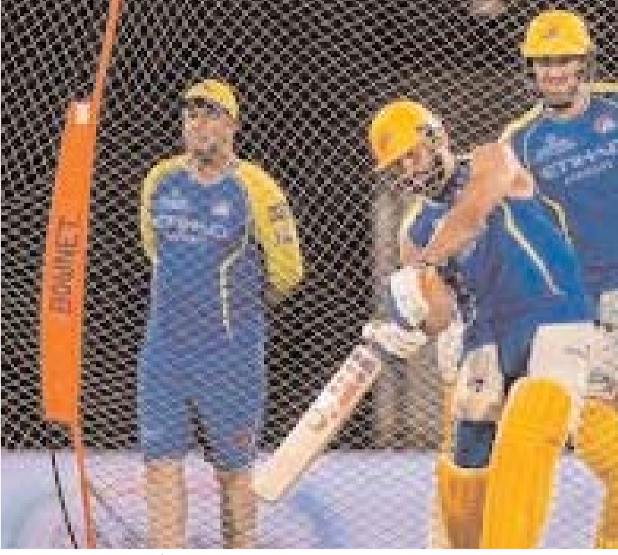
సతమతమవుతోంది. అయితే సీఎస్సీ తరువాతి మ్యాచ్ జరగనుంది. అయినా కూడా ఏప్రిల్ 23న ముంబై సన్రైజర్స్ హైదరాబాద్ (ఎన్ఆర్ఐపాక్) ఏప్రిల్ 18న ఇండియన్స్ తో జరిగే మ్యాచ్ లో ఆడనున్నాడని

ఇండియన్ ప్రీమియర్ లీగ్ (ఐపీఎల్) చరిత్రలో చెన్నై సూపర్ కింగ్స్ జట్టుకు ఓ ప్రత్యేక స్థానం ఉంది. ఈ లీగ్ లో ఏకంగా 5 సార్లు ట్రోఫీ ని గెలుచుకొని, మోస్ట్ సక్సెస్ ఫుల్ ఫ్రాంచైజీగా నిలిచింది. కానీ, గత రెండు సీజన్లుగా చెన్నై సూపర్ కింగ్స్ లీగ్ దశలో మ్యాచ్ గెలిచేందుకే తీవ్రంగా శ్రమిస్తోంది. కొన్ని సందర్భాల్లో పాయింట్స్ టేబుల్ లో అట్టడుగుభాగం ఉండి ట్రోఫీ కు గురవుతోంది. అయితే చెన్నై గెలుపులోనూ ధోనీ ఉండగా.. ఇప్పుడు టీమ్ లో ధోనీ లేకపోవడమే జట్టు వైఫల్యానికి ప్రధాన కారణమని ఫ్యాన్స్ అంటున్నారు. ఈ సీజన్ లో గాయం కారణంగా రెండు వారాల పాటు దూరమైన మాజీ కెప్టెన్ ఎంఎస్ ధోనీ.. లేకపోవడం చెన్నై టీమ్ వైఫల్యానికి కారణంగా తెలుస్తోంది. దీంతో ధోనీ ఎప్పుడూ స్టాడం సీఎస్సీ టీమ్ సహా అభిమానులు ఎంతో ఆశగా ఎదురుచూస్తున్నారు. అయితే శనివారం ఏప్రిల్ 18న సన్రైజర్స్ హైదరాబాద్ తో జరగనున్న మ్యాచ్ లో ధోనీ ఆడబోతున్నాడనే వార్తలు వచ్చాయి. కానీ, ఈ మ్యాచ్ కు కూడా ధోనీ అందుబాటులో ఉండడం లేదని సమాచారం. సీఎస్సీ మాజీ కెప్టెన్ ఎంఎస్ ధోనీ.. ఏప్రిల్ 23న వాంఖడే స్టేడియంలో ముంబై ఇండియన్స్ తో జరిగే ఐపీఎల్ 2026 మ్యాచ్ లో అందుబాటులో ఉంటాడని తాజా సమాచారం. పిక్చు కందరాల గాయం కారణంగా ఆరంభ మ్యాచ్ లకు దూరమైన సంగతి తెలిసింది. ధోనీ లేకుండా చెన్నై ఆడిన మ్యాచ్ లో 2 విజయాలు, 3 ఓటములతో