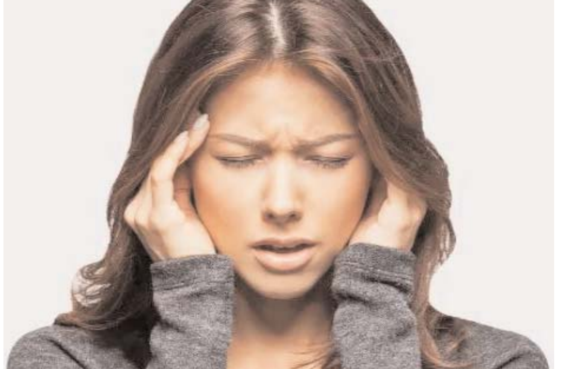
అవకాశం ఉంది. మైగ్రేన్ నివారణ మార్గాలు నియంత్రిత జీవనశైలి, ఆరోగ్యకరమైన ఆహారం, సమయానికి నిద్రపోవడం, ఒత్తిడిని తగ్గించడం వంటి మార్పులు మైగ్రేన్ ను తగ్గించడంలో సహాయపడతాయి. ప్రతిరోజూ యోగాసనాలు, ధ్యానం చేయడం వల్ల మైగ్రేన్ తీవ్రత తగ్గే అవకాశం ఉంది. ఎక్కువ నీరు తాగడం, తొందరగా జీర్ణం అయ్యే తేలికపాటి ఆహారం తీసుకోవడం మంచిది, రాత్రి సమయంలో అలసటం చేయకుండా తొందరగా భోజనం చేసే తగినంత విశ్రాంతి తీసుకోవడం కూడా మైగ్రేన్ ను తగ్గించడానికి దోహదం చేస్తుంది.