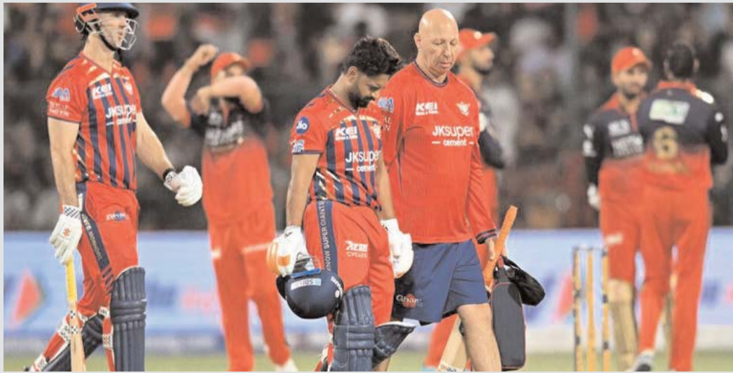
కలిగించినా, అతని పైటింగ్ స్పిరిట్ ను అంతా మెచ్చుకుంటున్నారు. ఈ మ్యాచ్ కు ముందు లక్నో ఓపెనర్ మిచెల్ మార్డ్ ట్రాన్స్ కార్పొరేషన్ మూట్లూడుతూ టీ20 క్రికెట్ మూడున్న తీరుపై ఆసక్తికర వ్యాఖ్యలు చేశాడు. ప్రస్తుత పరిస్థితుల్లో 2000 పరుగుల స్కోరు కూడా సురక్షితం కాదని, ఒకప్పుడు 200 పరుగులు చేస్తే గెలుస్తామనే నమ్మకం ఉండేదని గుర్తు చేశాడు. కానీ ఇప్పుడు అంత స్కోరు చేసినా ఇంకా కావా? అనే సందేహం కలుగుతోందని మార్డ్ పేర్కొన్నాడు.

ఐపీఎల్ 2026 సీజన్ లో భాగంగా బుధవారం ఎం. చిన్నస్వామి స్టేడియంలో జరిగిన రాయల్ ఛాలెంజర్స్ బెంగళూరు, లక్నో సూపర్ జెయింట్స్ మ్యాచ్ లో ఒక ఊహించని పరిణామం చోటుచేసుకుంది. ఎల్ఎస్ఐ కెప్టెన్ రిషబ్ పంత్ బ్యాటింగ్ చేస్తూ తీవ్రంగా గాయపడ్డాడు. మూడవ ఓవర్ లోనే ఎయిడెడ్ మార్నెజ్ మెంట్ అవుట్ అవుడంతో క్రీజ్ లోకి వచ్చిన పంత్, జోష్ హాజిల్వుడ్ వేసిన నాలుగో ఓవర్ లో ఇబ్బంది పడ్డాడు. హాజిల్వుడ్ సందించిన ఒక షార్ట్ డెలివరీని భారీ షాట్ ఆడబోయిన క్రమంలో బంతి నేరుగా పంత్ ఎడమ మోచేతికి బలంగా తగిలింది. ఆ దెబ్బకు పంత్ విపరీతమైన నొప్పితో మైదానంలోనే విలవిల్లాడిపోయాడు. ఫిజియో వచ్చి ప్రాథమిక చికిత్స చేసినప్పటికీ పంత్ నొప్పి తగ్గలేదు. ఆ బాధ భరించలేక అతను కన్నీళ్లు పెట్టుకోవడం అత్యధున్న వారందరినీ కలిపివేసింది. బ్యాటింగ్ కొనసాగించలేక రిటైర్డ్ హార్ట్ గా వెనుదిరిగే ముందు, తన వాచిని మోచేతిని బోలర్ హాజిల్వుడ్ కు చూపిస్తూ ఆవేదన వ్యక్తం చేశాడు. పంత్ మైదానాన్ని వీడటంతో లక్నో క్యాంప్ లో ఆందోళన మొదలైంది. అయితే, తన జట్టు కోసం పంత్ అద్భుతమైన పోరాట పటిష్టతను కనబరిచాడు. 16వ ఓవర్ లో ఆయుష్ బదోని అవుట్ అయిన తర్వాత, తన ఎడమ చేతికి భారీగా బ్యాండ్ కట్టుకుని మళ్లీ క్రీజ్ లోకి వచ్చాడు. తన ఆరోగ్యం కంటే జట్టు ప్రయోజనాలే ముఖ్యమని పంత్ నిరూపించాడు. అయితే ఒక్క పరుగుకే వెనుదిరిగడం ఫ్యాన్స్ కు నిరాశ