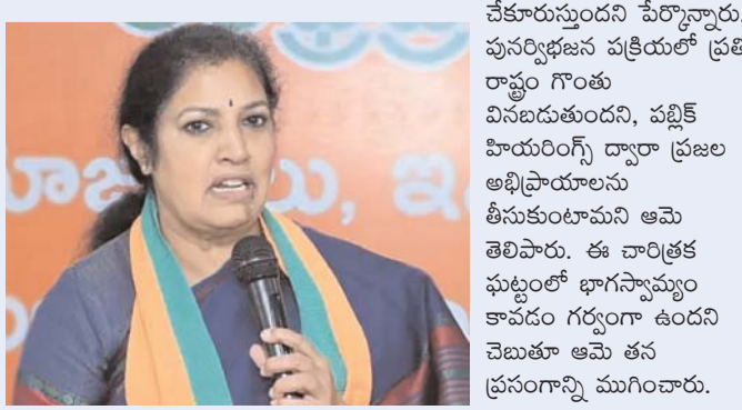
చేకూరుస్తుందని పేర్కొన్నారు. పునర్విభజన పక్రియలో ప్రతి రాష్ట్రం గొంతు విసబడుతుందని, పట్టిక హియరార్సీ ద్వారా ప్రజల అభిప్రాయాలను తీసుకుంటామని ఆమె తెలిపారు. ఈ చారిత్రక ఘట్టంలో భాగస్వాములగా కావడం గర్వంగా ఉందని చెబుతూ ఆమె తన ప్రసంగాన్ని ముగించారు.