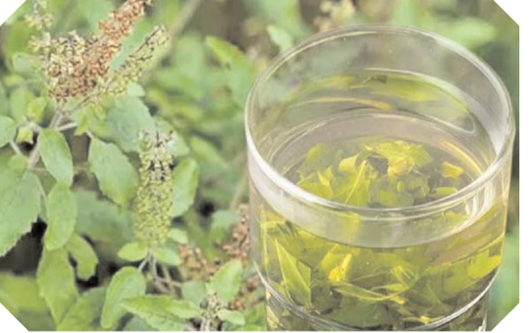
క్యాన్సర్ స్థాయిలు తగ్గుతాయి. అలాగే మీరు సహాయపడుతుంది. ఒత్తిడి లేకుండా ఉండేందుకు

సహజమైన డీటాక్సిఫైయర్. ఉదయాన్నే పరగడుపున తులసి నీటిని తాగడం వల్ల డీటాక్సిఫైకేషన్ జరుగుతుంది. ముఖ్యంగా ఉదయాన్నే ఖాళీ కడుపుతో తులసి నీటిని తాగడం వల్ల శరీరంలోని టాక్సిన్స్, క్రిములు బయటకు వెళ్లిపోతాయి. జీర్ణ సంబంధ వ్యాధులు దూరంగా ఉంటాయి. తులసి నీటిని తాగడం వల్ల చర్మ ఆరోగ్యానికి కూడా సహాయపడుతుంది. ఇందులోని యాంటీ బాక్టీరియల్, యాంటీ ఫంగల్ లక్షణాలు చర్మ పరిస్థితులకు చికిత్స చేయడానికి ఉపయోగపడతాయి. తులసి నీటిని తాగడం వల్ల చర్మం కాంతివంతంగా మారుతుంది. తులసి నీరు క్యాన్సర్ హాస్పిట్ స్థాయిలను నిర్మూలనచేసే సహాయపడుతుంది కొన్ని అధ్యయనాలు సూచిస్తున్నాయి. ఇది శరీరంలో ఒత్తిడిని కలిగించే ఒత్తిడి హార్మోన్ల అని కూడా పిలుస్తారు. తులసి నీటిని తాగడం వల్ల