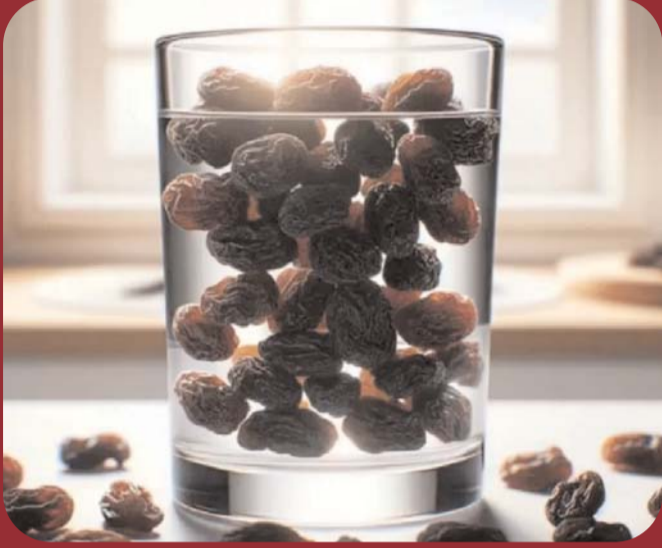
నానబెట్టిన ఎండుద్రాక్ష నీరు శరీరాన్ని హైడ్రేట్ గా ఉంచడంలో సహాయపడుతుంది.

ఎండుద్రాక్షను ఎప్పుడూ పారేయకండి. ఇందులో యాంటీ ఆక్సిడెంట్లు ఉంటాయి. ఇది ప్రీ రాడికల్స్ నుండి శరీరాన్ని రక్షిస్తుంది. ఈ నీటిలో ఉండే విటమిన్లు, మిగిలిన రోగనిరోధక శక్తిని కూడా మెరుగుపరుస్తాయి. ఎండుద్రాక్ష నానబెట్టిన నీటిని డిటాక్స్ వాటర్ గా తాగడం వల్ల శరీరంలో శక్తి స్థాయిలు పెరుగుతాయి. శారీరక మంట తగ్గుతుంది. కాలేయ పనితీరు మెరుగుపడుతుంది. ఇది రోగనిరోధక శక్తిని పెంచుతుంది. అలాగే బరువును తగ్గిస్తుంది. మీరు అధిక రక్తపోటుతో బాధపడుతున్నట్లయితే, మీరు తప్పనిసరిగా నీటిలో నానబెట్టిన ఎండుద్రాక్షను తీసుకోవాలి. ఈ నీటిలో పాటాషియం ఉంటుంది. ఇది రక్తపోటును అదుపులో ఉంచుతుంది. అంతేకాకుండా, ఈ పానీయంలో ఐరన్ ఉంటుంది. ఇది రక్తంలో హెమోగ్లోబిన్ స్థాయిని పెంచడంలో సహాయపడుతుంది. మీరు మలబద్ధకంతో బాధపడుతుంటే, నీటిలో నానబెట్టిన ఎండుద్రాక్షను తాగండి. ఈ పానీయంలో ఉండే ఫైబర్ జీర్ణవ్యవస్థ, ప్రేగుల ఆరోగ్యాన్ని మెరుగుపరుస్తుంది. ఎండుద్రాక్ష నానబెట్టిన నీరు శరీరంలో పేరుకుపోయిన అన్ని కాలుష్య కారకాలను బయటకు పంపడానికి సహాయపడుతుంది. 10-15 ఎండుద్రాక్షలను ఒక కప్పు నీటిలో రాత్రంతా నానబెట్టండి. మరుసటి రోజు ఉదయం నానబెట్టిన ఎండుద్రాక్షను తినండి. దానితో ఎండుద్రాక్ష నానబెట్టిన నీటిని తాగండి.