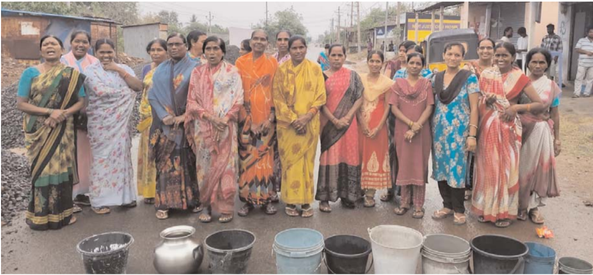
ఫోన్ చేస్తున్న స్టంభించిన పట్టణం వాళ్ల నిరసనను అర్థం చేసుకున్నందుకు అటు ఓటీసీ గెలిపించిన ప్రజాప్రతినిధులు ఇటు ప్రజలకు నీటిని సరఫరా అందజేయాలని మహిళలంతా ఖాళీ బందెలతో రోడ్లకి నిరసన వ్యక్తం చేయడం జరిగినది.

గోదావరి జిల్లా ప్రతినిధి (డి క్రైమ్ న్యూస్): బుధవారం రోజున రామగుండం పట్టణంలోని హౌసింగ్ బోర్డ్ కాలనీ ఇందిరమ్మ కాలనీ ఆదర్శ కాలనీ హనుమాన్ నగర్ లలో నివసిస్తున్న పలు కాలనీలకు సంబంధించి మున్సిపల్ వాటర్ గత మూడు రోజులుగా సరఫరా లేక అలాగే జెన్టీ నుండి వచ్చే సాగునీటి సరఫరా నిలిపివేసిన నేపథ్యంలో హౌసింగ్ బోర్డ్ కాలనీ గుట్ట ప్రాంతం కాబి బందెలతో రోడ్లకి వెళ్ళి గాని బావులను కానీ ఏర్పాటు చేయడానికి అవకాశం లేనందున త్రాగు నీటితో పాటు నిత్యావసరాలకు కూడా ఒక చుక్క నీరు లేదని మహిళలందరూ కాబి బందెలతో రోడ్లమీద నిలబడి మేము ఇన్ని రోజుల నుండి నీటి గురించి ఇన్ని అవస్థలు పడుతున్న స్థానిక ప్రజాప్రతినిధులు కన్నెత్తి కూడా చూడకుండా ఉండడం మమ్మల్ని విస్మయానికి గురి చేస్తున్నదని అలాగే సంబంధిత మున్సిపల్ సిబ్బంది ఇటువైపు రావడమే మానేశారని నీటి సమస్య గురించి