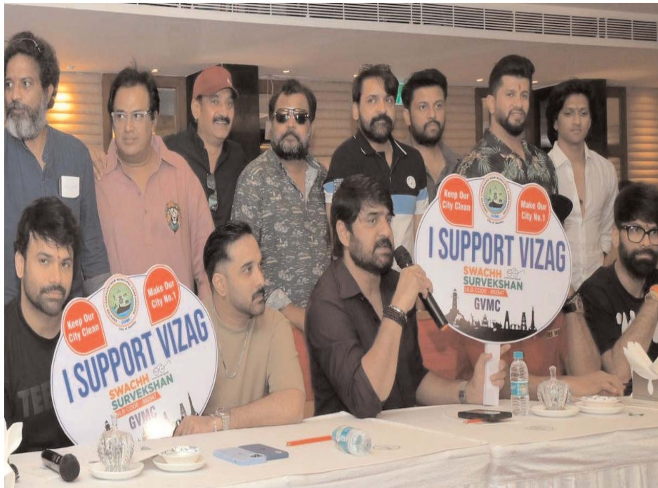
లీగ్ శనివారం నుంచి జరగనుంది. దీంతో వైజాగ్ సిటీ మరోసారి సినిమా అభిమానులు, క్రికెట్ ఫ్యాన్స్ కి వేదికగా మారబోతోంది. అయితే ఓ మంచి ఉద్దేశంతో సినిమా నటులు చేపడుతున్న ఈ క్రీడా సందరాన్ని ఈసారి బాగా నిర్వహించి అంతర్జాతీయ స్టాండ్స్ హాల్ గా విశాఖను తీర్చిదిద్దాలని ప్రభుత్వం భావిస్తోంది. ఈనెల

బహుశా, టీ20, వరల్డ్ కప్ మ్యాచ్ లు చూసే క్రికెట్ అభిమానులతో పాటు సినిమా స్టార్స్ ఫ్యాన్స్ కి మరో గుడ్ న్యూస్. వెండితెరపై హీరోలుగా కనిపించే సినిమా హీరోలు అంతా కలిసి ప్రతి సంవత్సరం సెలబ్రిటీ క్రికెట్ లీగ్ పేరుతో గ్రాండ్ లో కనిపిస్తారు. ఏటా జరిగినట్లుగానే ఈసారి కూడా సీసీఎల్ ఏర్పాట్లు పూర్తి అవుతున్నాయి. ఆంధ్రప్రదేశ్ లోని విశాఖపట్నం మధురవాడ ఏసీఏ - వీడిసీఏ స్టేడియంలో ఈనెల 28, మార్చి 1 వ తేదీల్లో టాలీవుడ్ సెలబ్రిటీ క్రికెట్ లీగ్ పోటీలు నిర్వహించనున్నట్లు ప్రముఖ సినిమా హీరోలు శ్రీకాంత్, తరుణ్ తెలిపారు. ఈసందర్భంగా మరోసారి సినిమా స్టార్స్ అందరినీ చూడటానికే అభిమానులు సిద్ధం కావాలని, స్టార్ జట్లలో ఏ టీమ్ లీగ్ విజేతగా నిలుస్తుంది? చూడాలని సినిమా హీరోలు పిలుపునిచ్చారు. సినిమాల్లో కనిపిస్తూ ప్రేక్షకుల్ని మెప్పించే టాలీవుడ్ హీరోలు, నటులు తెరపైనే కాదు రియల్ లైఫ్ లో కూడా హీరోలుగానే పేరు తెచ్చుకుంటున్నారు. సెలబ్రిటీ క్రికెట్ లీగ్ పేరుతో టాలీవుడ్ కి చెందిన యంగ్ హీరోలు, నటులు అంతా కలిసి క్రికెట్ మ్యాచ్ లు ఆడతారు. అయితే ఇది అభిమానుల్ని రంజితచేయడంతో పాటు ఈ మ్యాచ్ ల ద్వారా వచ్చే ఆదాయాన్ని పేద పిల్లల చదువు, సిఎం సహాయ నిధి, దాతృత్వ కార్యక్రమాలకు వినియోగిస్తారు. ప్రతి సంవత్సరం మాదిరిగానే ఈసారి కూడా విశాఖపట్నంలో ఈ సెలబ్రిటీ క్రికెట్