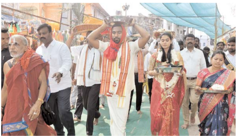
వైర్లెస్ మరియు కౌన్సిలర్లు, దేవస్థాన కమిటీ వైర్లెస్ మరియు కమిటీ సభ్యులు, మున్సిపల్ కమిషనర్, దేవస్థాన కమిటీ,

ప్రసాదించాలని మరియు ధర్మపురి శ్రీ లక్ష్మీనరసింహ స్వామి దివ్య ఆశీస్సులు జిల్లా ప్రజలందరికీ కలగాలని ఆకాంక్షించారు. బ్రహ్మోత్సవాలకు విచ్చేసే భక్తులకు ఎలాంటి ఇబ్బందులు కలగకుండా తగిన ఏర్పాట్లు చేయాలని, శానిటేషన్, పారిశుధ్య నిర్వహణ నిరంతరం చేపట్టాలని, భక్తుల ఆధిక రద్దీని దృష్టిలో ఉంచుకొని సురక్షిత త్రాగునీటి సౌకర్యం సమృద్ధిగా కల్పించాలని సంబంధిత అధికారులను ఆదేశించారు. అందరు అధికారులు సమన్వయంతో పని చేస్తూ భక్తులందరికీ అన్ని రకాల సౌకర్యాలు కల్పించాలని ఆదేశించారు. ఈ కార్యక్రమంలో ఆర్డీవో, జిల్లా స్టాంపు అధికారులు, మున్సిపల్