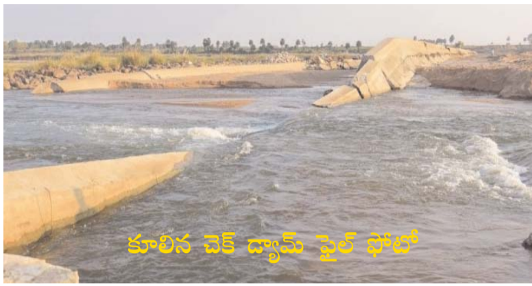
కూలిన చెక్ డ్యామ్ పై రోజులు

బ్యారో,(డి క్రైమ్ న్యూస్): పెద్దపల్లి జిల్లా ఓడెల మండలం గుంపుల తణుగుల గ్రామాల్లో మధ్య గల చెక్ డ్యామ్ కూలి నేటికి సరిగ్గా 100 రోజులు పుణ్యకాలం గడిచిపోయింది. గత సంవత్సరం నవంబర్ 21 అర్ధరాత్రి కూల్చివేత... లేక కూలిపోవడం.. రెండిల్లో ఏదో ఒకటి జరిగింది. కానీ ఏం జరిగిందన్న దానికంటే ఎవరూ బాధ్యత తీసుకోలేదన్నదే పెద్ద దుర్ఘటన.ఇది ఒక రాజకీయ విద్వేషం శత దినోత్సవ వేడుక. డ్యాం కూలింది... మాటల గోడలు మాత్రం కూలలేదు. వేల ఎకరాల భవిష్యత్తు ఇసుకలో... నేతల మాటలు గాలిలో. నాణ్యత లోపమా? ఇసుక మాఫియా? నిజం మాత్రం అదే నీటిలో గల్లంతయింది. రాజకీయ యుద్ధం గెలిచింది... బక్క చిక్కిన రైతు ఓడిపోయాడు. కేసు లేదు... నిందితులు లేరు.. అదే కాక పునర్నిర్మాణం అస్సమాలు లేదు బాధ మాత్రం రైతుదే. కూలింది డ్యామ్ మాత్రమే కాదు.. రైతు నమ్మకం. శత దినోత్సవము చేసుకోవాలా?