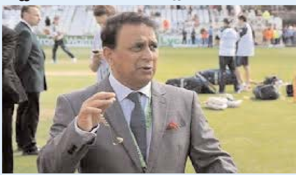
వెస్టిండీస్ పై కూడా విజయం సాధించి సెమీఫైనల్ పాగా వేసింది. ఇక ఇంగ్లాండ్ జట్టుపై గవాస్కర్ ప్రశంసలు కురిపిస్తూ.. ఆ జట్టులో స్పిన్, పేస్ బౌలింగ్ విభాగం చాలా పటిష్టంగా ఉందని అభిప్రాయపడ్డారు. టోర్నీ అరంభంలోనే పాల్గొన్న అతికష్టంగా నెగ్గి, వెస్టిండీస్ చేతిలో ఘోరంగా ఓడిపోయినప్పటికీ.. ఆ తర్వాత పుంజుకున్న తీరు

టీ20 వరల్డ్ కప్ 2026 కైమాక్స్ కు చేరుతున్న కొద్దీ అంచనాలు పెరిగిపోతున్నాయి. ఈ క్రమంలో భారత క్రికెట్ దిగ్గజం సునీల్ గవాస్కర్ చేసిన వ్యాఖ్యలు ఇప్పుడు క్రీడా వర్గాల్లో పెను సంచలనం రేపుతున్నాయి. ఈసారి కచ్చు గెలిచే ఫేవరెట్ల జాబితా నుంచి ఆయన టీమిండియాను పూర్తిగా పక్కన పెట్టేశారు. భారత్ సెమీఫైనల్ రేసులో ఉన్నప్పటికీ, టైటిల్ నెగ్గే సత్తా మాత్రం ప్రస్తుతానికి ఇంగ్లాండ్, సౌతాఫ్రికా జట్లకే ఉందని గవాస్కర్ కుండబద్దలు కొట్టారు. సొంత గడ్డపై జరుగుతున్న టోర్నీలో భారత్ కు మద్దతు ఇవ్వకుండా, గవాస్కర్ ఇలాంటి వ్యాఖ్యలు చేయడం ఇప్పుడు చర్చనీయాంశంగా మారింది. ప్రస్తుత సూపర్ 8 పరిస్థితులను గమనిస్తే.. భారత్, వెస్టిండీస్ జట్టు సెమీస్ బెర్ల కోసం హోదాహోదాగా పోరాడుతున్నాయి. కోల్ కతాలోని ఈడెన్ గార్డెన్స్ లో జరగబోయే భారత్-వెస్టిండీస్ మ్యాచ్ సెమీస్ దిశగా అత్యంత కీలకం కానుంది. అయితే గవాస్కర్ మాత్రం సౌతాఫ్రికా, ఇంగ్లాండ్ జట్ల బౌలింగ్, బ్యాటింగ్ డెబ్బీ చూసి ముగ్గులయ్యారు. ముఖ్యంగా సౌతాఫ్రికా ఈ టోర్నీలో ఇప్పటివరకు ఒక్క మ్యాచ్ కూడా ఓడిపోకుండా అత్యంతగా దూసుకుపోతోంది. గ్రూప్ దశలో కెనడా, ఆస్ట్రేలియా, న్యూజిలాండ్ వంటి జట్టును ఓడించి, సూపర్ 8లో భారత్,