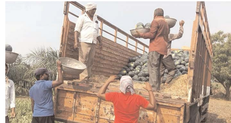
పుచ్చకాయలను లోడ్ చేస్తున్న గూడెం రైతులు

బ్యారో, (డి డి కెమ్ న్యూస్): పెద్దపల్లి జిల్లా ఓడెల మండలంలో అదొక చిన్న గ్రామం. పేరు గూడెం. గుర్తు పట్టడం కోసం పక్కన ఉన్న గుంపులను చెప్పి గుంపుల గూడెం అంటేనే ఎవరైనా గుర్తుపట్టేది. ఇక్కడి రైతుల కృషి పట్టుదలతో ఇప్పుడు ఈ ఊరు పెద్దపల్లి జిల్లాలోనే పుచ్చకాయలకు కేంద్రంగా కొత్త గుర్తింపును సంపాదించింది. ఒక్కప్పుడు గుంపులగూడెం గా పేరుగాంచిన ఈ గ్రామం ప్రస్తుతం పుచ్చకాయల గూడెం గా మారుతోంది. గ్రామంలోని రైతులు గత ఐదారు సంవత్సరాలుగా పుచ్చకాయ సాగులో మంచి మెలకువలు పాటిస్తూ గణనీయమైన దిగుబడులు సాధిస్తున్నారు. వందల ఎకరాల్లో పంట సాగు చేస్తూ ఆదర్శంగా నిలుస్తున్నారు. ఊహించని దిగుబడులు సాధిస్తూ రికార్డులు సృష్టిస్తున్నారు. వాన కాలంలో పత్తి పంట పూర్తి అయిన తర్వాత యాసంగి కాలంలో మొక్కజొన్నతో పాటు అనేక మంది రైతులు పుచ్చకాయ సాగు చేయడానికి మొగ్గు చూపుతున్నారు.