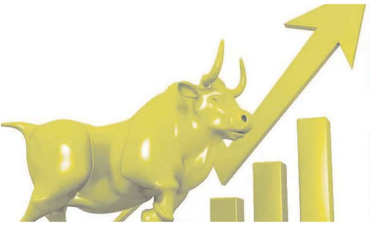
0.83 శాతం ఎగబాకి 25,682.75 వద్ద నిలిచింది. అమెరికా-ఇరాన్ మధ్య చర్చలు

ముంబై: దేశీయ స్టాక్ మార్కెట్లు లాభాల్లో ముగిశాయి. బాంబే స్టాక్ ఎక్స్చేంజ్ (బీఎస్ఎ) ప్రధాన సూచీ సెన్సెక్స్, నేషనల్ స్టాక్ ఎక్స్చేంజ్ (ఎన్ఎస్ఈ) సూచీ నిఫ్టీ రెండూ 0.8 శాతం మేర పుంజుకున్నాయి. విద్యుత్తు, బ్యాంకింగ్, ఇతర ఆర్థిక రంగ షేర్లకు మదుపరుల కొనుగోళ్లు మద్దతు లభించడం కలిసింది. ఈ క్రమంలోనే సెన్సెక్స్ 650.39 పాయింట్లు లేదా 0.79 శాతం ఎగిసి 83,277.15 వద్ద స్థిరపడింది. ఫలితంగా బీఎస్ఎ నమోదిత సంస్థల మార్కెట్ విలువ ఈ ఒక్కరోజే రూ.3,11,982.13 కోట్లు పెరిగి రూ.4,68,58,625.33 కోట్లకు చేరింది. ఇక నిఫ్టీ 211.65 పాయింట్లు లేదా