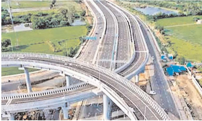
రహదారుల పొడవున బీ కారిడార్లను ఎన్హెచ్ఐఐ అభివృద్ధి చేయనున్నది. తేనెటీగలు, ఇతర పరాగ సంపర్కాల సాయంతో ఏడాదంతా జాతీయ రహదారుల

తాజా డీల్లో మహారాష్ట్రలోని జాతీయ రహదారి 53పై 255.97 కిలోమీటర్ల పొడవున ఉన్న అమరావతి-చిఖ్లి-టార్నాడ్ సెక్షన్, ఏపీలోని జాతీయ రహదారి 16పై 54.38 కిలోమీటర్ల పొడవున ఉన్న గుండుగోలను-చిన్న అవుతపల్లి సెక్షన్ల సేత అవుతున్నాయి. ఇదిలావుంటే ఎన్హెచ్ఐఐ అనేది ఓ ఇన్ఫ్రాస్ట్రక్చర్ ఇన్వెస్ట్మెంట్ ట్రస్ట్ (ఇన్వెట్). దీన్ని ఎన్హెచ్ఐఐ స్వాస్థ్యం చేస్తుంది. ఎన్హెచ్ఐఐ డ్వారా జరిగిన మొత్తం ఆస్తుల నగదీకరణ విలువ రూ.49,858 కోట్లుగా ఉన్నది. ఎన్హెచ్ఐఐ యూనిట్లు దేశీయ ప్రధాన స్టాక్ మార్కెట్లైన బీఎస్ఎ, ఎన్ఎస్ఈలలో నమోదయ్యాయి. ఇదిలావుంటే పర్యావరణ ఒత్తిడిని తగ్గించేందుకు దేశంలోని జాతీయ