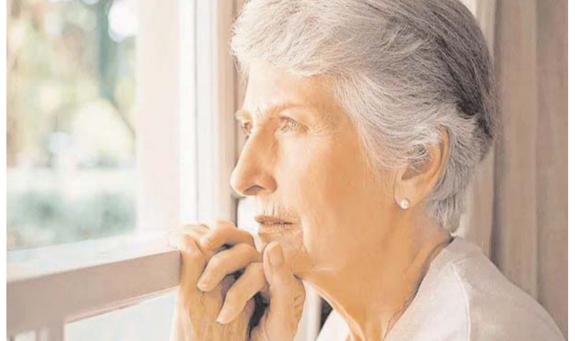
వృద్ధులు, వారి కుటుంబాలు అవసరమైన సహాయం పొందగలిగేలా ముందస్తు చర్యలు తీసుకోవాలని సిఫారసు చేస్తున్నారు. సకాలంలో రోగ నిర్ధారణ చేయడం వల్ల మెరుగైన చికిత్స అందించే అవకాశం ఉంటుందని చెబుతున్నారు.

చిత్త వైకల్యాన్ని సకాలంలో నిర్ధారించడం.. ప్రధాన సవాలుగా మారుతున్నది. మనిషి జ్ఞాపకశక్తిని దెబ్బతీసి ఈ మానసిక రుగ్గుత.. చాలా అలసటగా బయటపడుతున్నది. లక్షణాలు కనిపించినా.. సంపూర్ణంగా నిర్ధారించడానికి సగటున మూడున్నరేళ్ల సమయం పడుతున్నది. 'ఇంటర్వెన్షన్ జర్నల్ ఆఫ్ జెరియాట్రిక్ సైకియాట్రీ'లో ప్రచురితమైన తాజా అధ్యయనం ఈ విషయాన్ని వెల్లడించింది. డైమెన్షియా నిర్ధారణపై 'యూనివర్సిటీ కాలేజ్ లండన్'లోని సైకియాట్రీ విభాగానికి చెందిన పరిశోధకులు తాజాగా ఓ అధ్యయనం నిర్వహించారు. ఇందుకోసం యూరప్, అమెరికా, ఆస్ట్రేలియా, చైనాలో ఇంకా ముందే ప్రచురితమైన 13 అధ్యయనాలను క్లుప్తంగా పరిశీలించారు. ఈ సందర్భంగా 30,257 మందికి చెందిన డేటాను సమీక్షించారు. ఇందులో భాగంగా.. చిత్త వైకల్యం ప్రపంచవ్యాప్తంగా 57 మిలియన్లకు పైగా ప్రజలను ప్రభావితం చేస్తున్నదని గుర్తించారు. చాలా దేశాలలో రోగ నిర్ధారణ సర్టిఫై జరగడం లేదని చెబుతున్నారు. చిత్త వైకల్యం ప్రారంభ దశలో జ్ఞాపకశక్తి కోల్పోవడం, పదాలను కనుగొనడంలో ఇబ్బంది, కొందరగోళంతోపాటు మానసిక స్థితి, ప్రవర్తనలో మార్పులు కనిపిస్తాయని అధ్యయనకారులు పేర్కొంటున్నారు. చాలామంది ఈ డైమెన్షియా లక్షణాలను సాధారణ వ్యధాల్లో లక్షణాలుగా భావిస్తున్నారని, దాంతో వారికి సరైన వైద్యసాయం అందడం లేదని అంటున్నారు. కొందరిలోనివైతే.. రోగ నిర్ధారణకు 4.1 ఏళ్లు పట్టవచ్చునని పేర్కొంటున్నారు. దాంతో బాధితులకు మెరుగైన చికిత్స అందించడం అలసటపరుస్తున్నదని ఆందోళన వ్యక్తం చేస్తున్నారు. దీనిని నివారించడానికి.. డైమెన్షియా ప్రారంభ లక్షణాలపై అవగాహన కార్యక్రమాలు నిర్వహించాలని, చిత్త వైకల్యం ఉన్న