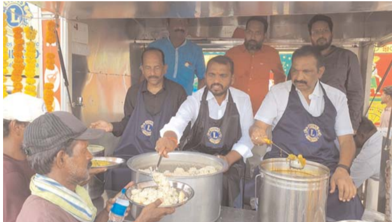
కరీంనగర్ టౌన్, మార్చి 30 (డి డిఎస్ స్యూస్): మానవ సేవయే మాధవ సేవగా భావించి, లయన్స్ క్లబ్ ఆఫ్ కరీంనగర్ గత ఏడాది కాలంగా నగరంలో నిరంతరంగా నిర్వహిస్తున్న అన్నదాన కార్యక్రమం నేటితో ఏడవవందంతోగా 365 రోజులు పూర్తి చేసుకుంది. ఈ మైలురాయిని