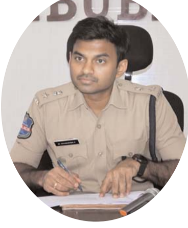
మెరుగుపరచడానికి అవసరమైన సూచనలు చేస్తూ, ప్రతి కేసులో చట్టపరమైన విధానాలను

సమగ్రంగా సేకరించడం ద్వారా కోర్టులో శిక్షల శాతం (జురీ అజిమెంటేషన్) పెంచే దిశగా కృషి చేయాలని ఆదేశించారు. ఆధునిక సాంకేతిక పద్ధతులను వినియోగిస్తూ దర్యాప్తు నాణ్యతను మరింత బలోపేతం చేయాలని తెలిపారు. సమావేశం అనంతరం, ఇటీవల మూడు కేసుల్లో నిందితులకు శిక్షలు విధించబడేలా కృషి చేసిన సీడీఐలు మరియు సంబంధించిన పోలీస్ అధికారులను ఎస్సీ డా. శబరీష్ అభినందించి, ప్రశంసా పత్రాలను అందజేశారు. వారి పనితీరును ఇతర అధికారులు ఆదర్శంగా తీసుకోవాలని సూచించారు.