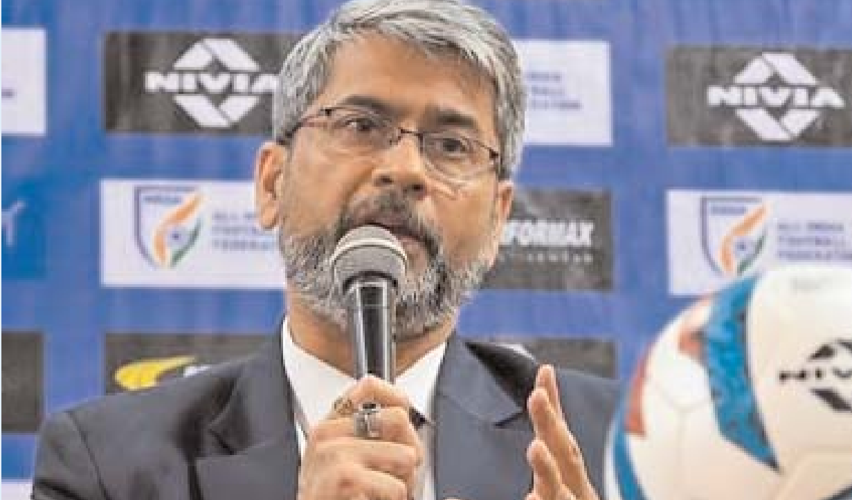
నడిపించారు. ఫిఫా మహిళల ఫుట్ బాల్ డెవలప్ మెంట్ కమిటీ 2029 వరకు ఆ హోదాలో కొనసాగుతారు. సభ్యులగా నియమితులైన తొలి భారతీయురాలిమే. 2025 నుంచి